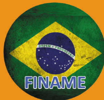
PRODUTO 100% NACIONAL, CONTRIBUINDO COM A ECONÔMIA DO BRASIL