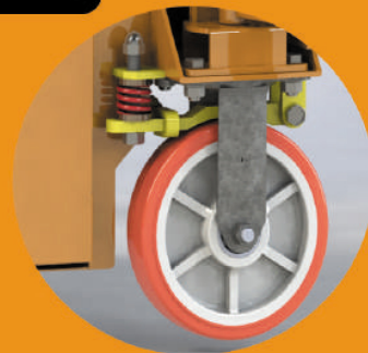
FREIOS DE TRABALHO AUTOMÁTICO