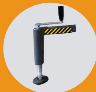
PATOLAS DE APOIO COM BLOQUEIO ELÉTRICO APENAS ACIMA DE 5 METROS DE ALTURA DE TRABALHO