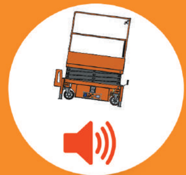
SENSOR DE NÍVEL COM BLOQUEIO DE SEGURANÇA