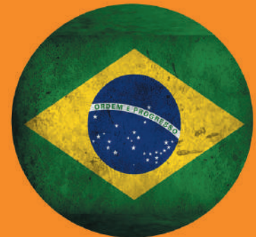
PRODUTO 100% NACIONAL, CONTRIBUINDO COM A ECONOMIA DO BRASIL