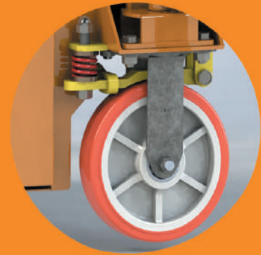
FREIOS DE TRABALHO AUTOMÁTICO